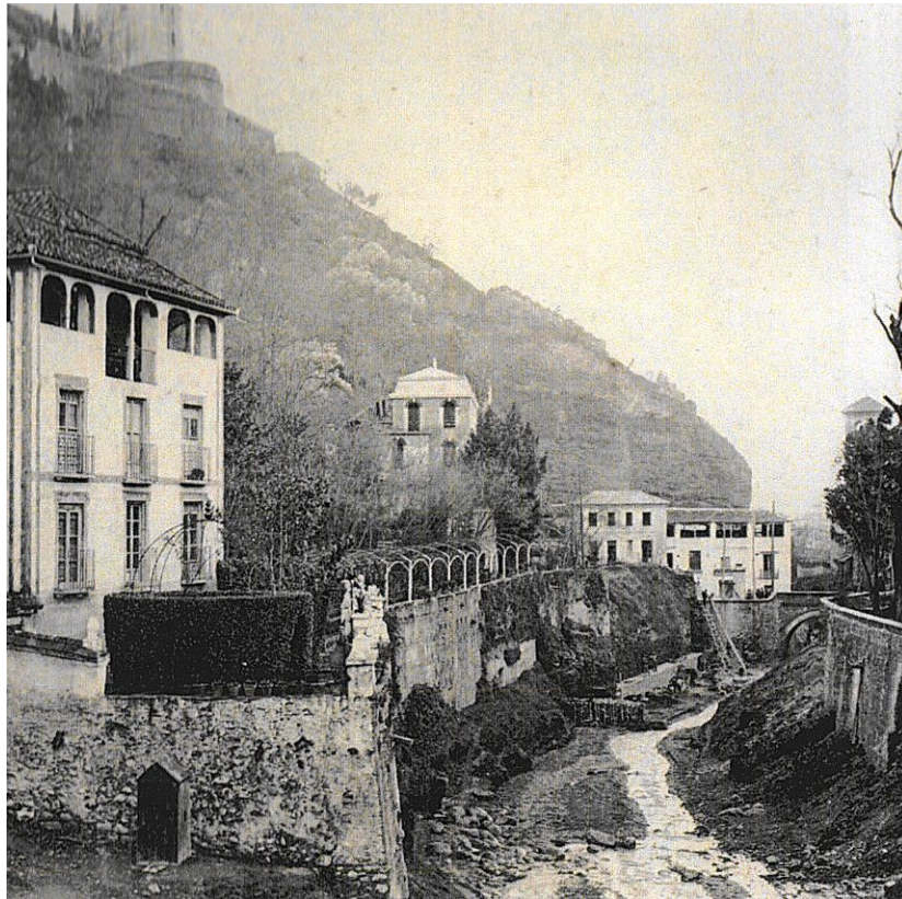
PANORAMICA DE A.FABERT 1910. En primer lugar el carmen del Granadillo desaparecido tras un incendio en 1960, seguido del Hotel Reúma y al fondo las casas de las Chirimías.

La Junta de Gobierno del Colegio Oficial de Arquitectos considera que el proyecto, en cuanto a la instalación del ascensor, cumple con la Ley 51/2003 de 2 de diciembre, de “IGUALDAD DE OPORTUNIDADES, NO DISCRIMINACIÓN Y ACCESIBILIDAD UNIVERSAL DE LAS PERSONAS CON DISCAPACIDAD” y del Real Decreto 505/2007, de 20 de abril, por el que se aprueba la Orden VIV/561/2010 que regula las “CONDICIONES BÁSICAS DE ACCESIBILIDAD Y NO DISCRIMINACIÓN DE LAS PERSONAS CON DISCAPACIDAD PARA EL ACCESO Y UTILIZACIÓN DE LOS ESPACIOS PÚBLICOS URBANIZADOS Y EDIFICACIONES” , de aplicación a partir del día 1 de enero de 2019 para todos aquellos espacios públicos urbanizados y edificios existentes que sean susceptibles de ajustes razonables o cuando no sea posible de soluciones alternativas que garanticen la máxima accesibilidad posible.