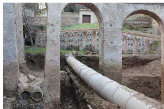
IMAGEN TRAS LA EXCAVACION