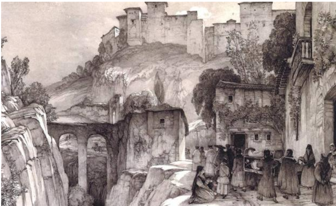
LITOGRAFIA J.F.LEWIS.1833. EN PRIMER LUGAR MOLINO DEL ALGIBILLO, AL FONDO MOLINO DEL REY CHICO JUNTO AL ACUEDUCTO

Entendemos que no cabe duda, de la finalidad del proyecto que no es otra sino la recuperación y adaptación, para el uso, disfrute y por tanto conocimiento de la ciudadanía, de un espacio desconocido para la misma y que representa como ninguno los valores y el concepto de paisaje cultural. Considerar que el lugar está concebido “para ser mirado , como lo ha sido hasta la actualidad” reflejaría una opinión cortoplacista que se correspondería con el espacio de tiempo que transcurre durante la segunda mitad del siglo XX en la que se produce el cercado de las parcelas del Granadillo y Chirimías y el enterramiento del barranco de Fuente Peña, previo entubamiento del arroyo del Rey Chico, generando un espacio urbano cerrado a la ciudad, privando a varias generaciones del disfrute, acceso y conocimiento de una zona, en la que yacían semienterradas las estructuras de las que teníamos conocimiento por los grabados y fotos de los viajeros románticos, sin que el imaginario popular tuviera certeza de la veracidad de esas imágenes o de su localización.