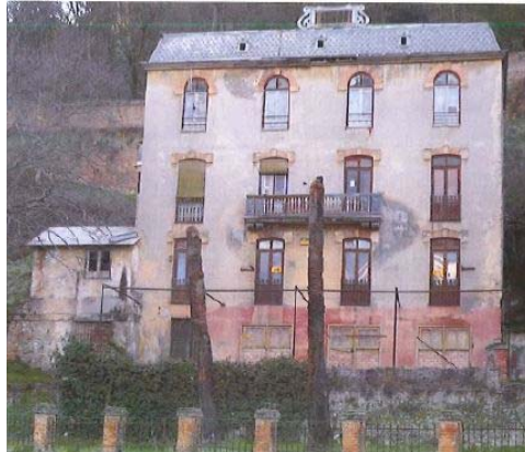
FACHADA HOTEL REUMA . INTERVENCION ARQUEOLOGICA DE APOYO PUNTUAL A LA CONSERVACION Y LIMPIEZA DEL HOTEL REUMA 2014. MANUEL J. LINARES LOSA, ARQUEOLOGO

escasez de referencias y de datos relativos a estas 2 edificaciones, especialmente la del Hotel Reúma, que se reducen a fotografías panorámicas de la 2ª mitad del siglo XIX.