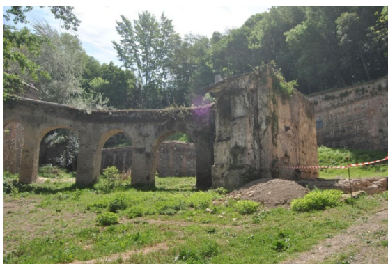
IMAGEN ANTES DE LA EXCAVACION