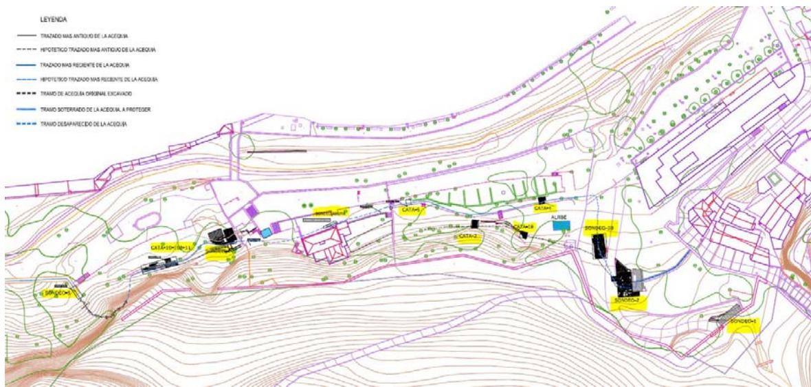
PLANO 03.1 DEL PROYECTO: ARQUEOLOGIA: LOCALIZACION DE SONDEOS Y CATAS REALIZADAS

En relación a la ausencia de Intervención arqueológica previa, decir todo lo contrario: en el Proyecto consta el documento “Intervención arqueológica Puntual en la margen izquierda del Río Darro” suscrito en mayo de 2020 por un equipo de 4 arqueólogos dirigidos por D. Alberto García Porras, profesor titular del Departamento de Historia Medieval de la Universidad de Granada (UGR) y que recoge la actividad encargada y realizada desde 2017 y que se llevó a cabo inicialmente mediante 5 sondeos, 14 catas a lo largo de todo el recorrido de la acequia (planos 03.1 y 03.2), siendo ampliada a un seguimiento arqueológico en el entorno del acueducto del Rey Chico y a un análisis murario de estructuras emergentes y muros perimetrales en el mismo entorno.